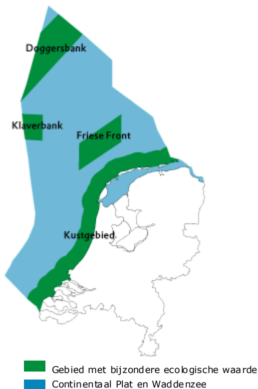
Figuur 1. Gebieden in de Noordzee met ecologische waarde

In de Nota Ruimte worden vijf gebieden aangewezen die beschermd moeten worden om hun bijzondere ecologische waarde: Doggersbank, Klaverbank, Centrale Oestergronden, Friese Front en kustzee. In het Integraal Beheerplan Noordzee 2015 hebben vier van deze gebieden een vaste begrenzing gekregen (zie figuur 1). De Centrale Oestergronden en de kustzee tussen Bergen en Hoek van Holland zijn niet aangewezen in het Integraal Beheerplan Noordzee 2015. Voor de wel aangewezen gebieden moet het beschermingsregime nog vastgesteld worden. Hierdoor kan de druk op de natuur in deze gebieden afnemen.